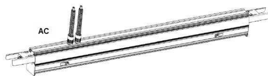
Diagrama de conexión